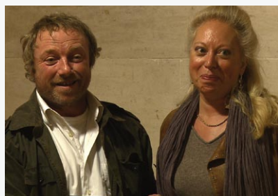
↑ L'entreprise Dieudonné a été couronnée du prix de la Création.