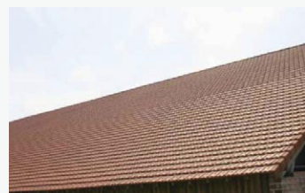
↓ ... et un prix spécial pour le maire de La Grève-sur-Mignon !

Les arêtiers sont en tige de botte scellés. Aux lucarnes, les rives sont en tuiles scellées. Toutes les gouttières, descentes, noues, etc., sont en cuivre. Les modèles de tuiles et les coloris ont obtenu l'aval de l'ABF.