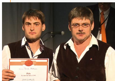
↑ L'entreprise Pascal Martineau a reçu le prix Esthétique.